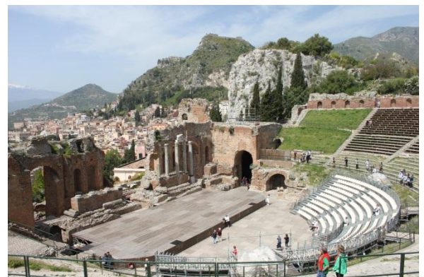
Il teatro Greco